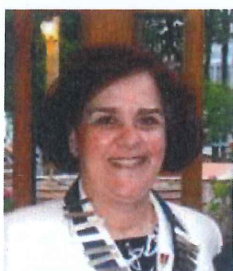
ΠΡΟΠΡΟΕΔΡΟΣ ΕΛΕΝΗ ΦΕΙΔΑ - ΤΡΙΓΚΑ