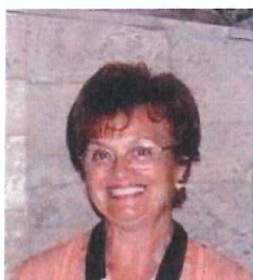
ΑΝΤΙΠΡΟΕΔΡΟΣ ΓΙΟ ΚΟΝΤΟΠΟΥΛΟΥ