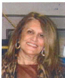
ΠΡΟΕΔΡΟΣ ΕΛΕΝΗ ΜΠΑΛΤΖΗ